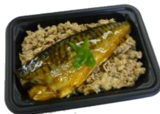
●さばほぐし身弁当(醤油)