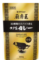
厨房王 コク旨カレー