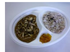
☆雑穀米きのことカレー