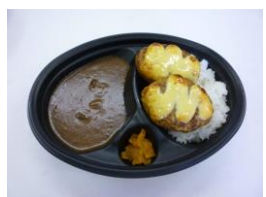
☆チーズハンバーグカレー