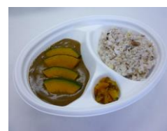
☆雑穀米かぼちゃカレー