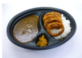
☆イカリングカレー