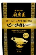
厨房王 ビーフカレー