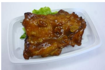
●チキステーキ にんにく醤油味