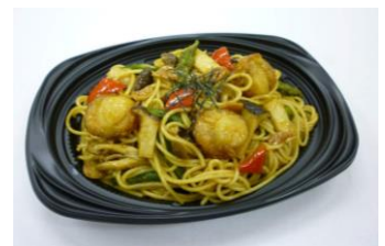
●ホタテとアスパラの ガーリック醤油パスタ