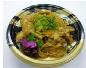
●にんにく香る 豚カルビ丼