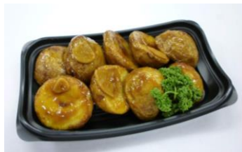
●ポテト ガーリック醤油味