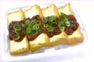
●厚揚げの 大豆そぼろみそがけ