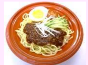
●大豆そぼろ使用 ジャージャー麺