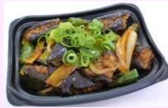
●大豆そぼろ使用 麻婆ナス丼