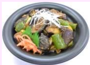
●なすとピーマンの 大豆そぼろみそ和え