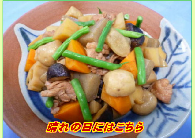
晴れの日にはこちら

規格: 1390g 旬のキャベツを使用し、お肉がたっぷり入った回鍋肉です。単品販売、弁当に、丼にもご使用頂けます。