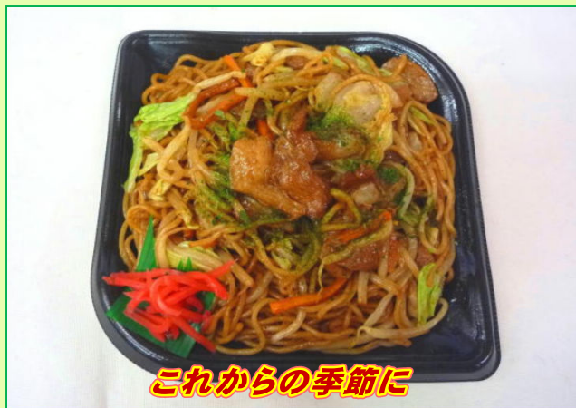
これからの季節に