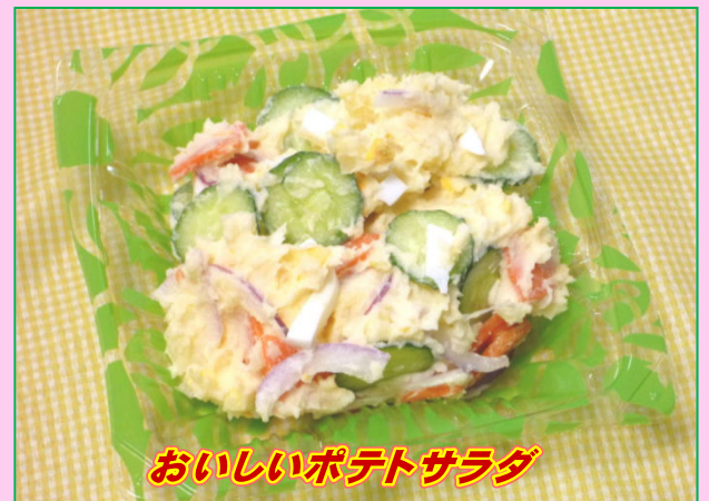
おいしいポテトサラダ

規格: 2630g 野菜をたっぷりを使用したソース焼きそばです。液体ソースにははちみつを使用しています。