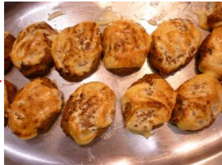
ハンバーグに上掛けして焼くだけ！ 簡単オペレーション