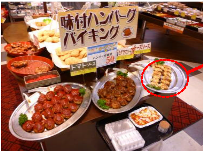
ハンバーグバイキング (チーズハンバーグ)