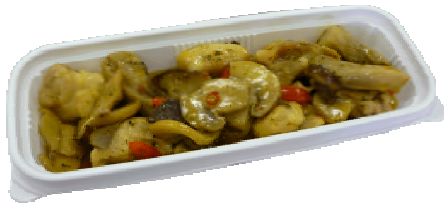
鶏肉のアヒージョ